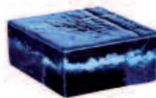
BLU VETROPIENO - QUADRATO