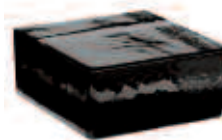
NORDICA VETROPIENO - QUADRATO