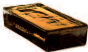
SIENA VETROPIENO - RETTANGOLARE