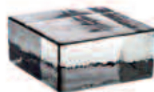
NEUTRO VETROPIENO - QUADRATO