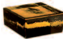
SIENA VETROPIENO - QUADRATO