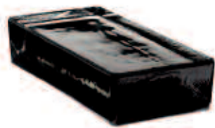
NORDICA VETROPIENO - RETTANGOLARE